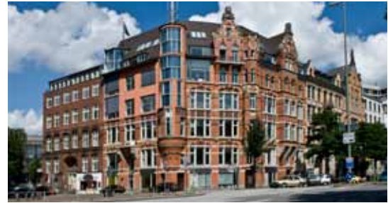
Firmenzentrale Salomon Invest, Hamburg.